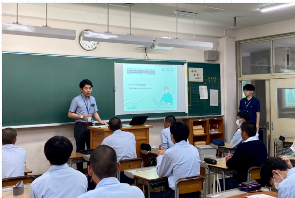
日本政策金融公庫様による出張授業の様子

2年生特進クラスでは、「新しい木之本のおみやげ」をテーマに特別授業を実施。日本政策金融公庫様や地域の起業家の方にご協力いただき、「ビジネス」の基本について学びました。